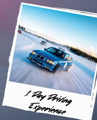
1 Day Driving Experience